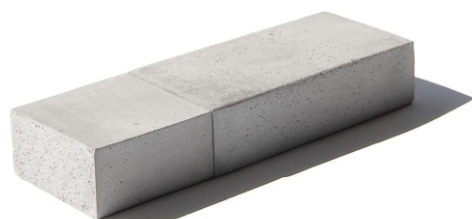
NB01 – Art. Nr. 20012

Eine Veredelung wird auf dem Betonspeicher ab einer Auflage von 50 Stück angeboten.