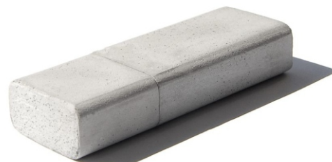
NB02 – Art. Nr. 20143

Material: Beton Maße: 65 x 24 x 14 mm Gewicht: 33g Veredelung: Druck Logo Fläche: Vorderseite 63 x 22 mm Rückseite 63 x 22 mm Vorderseite Kappe 20 x 22 mm Rückseite Kappe 20 x 22 mm